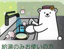
給湯のみお使いの方